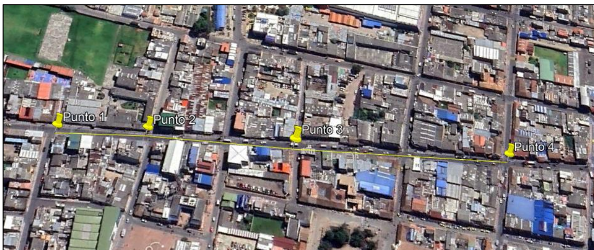
Ilustración 1. Recorrido

Se realizó recorrido de control y vigilancia en el cuadrante 4, barrio Centro el día 20 de junio del 2024, desde las coordenadas 4°43'8.023" N - 74°12'45.444" W hasta las coordenadas 4°42'56.311" N - 74°12'38.197" W (ver ilustración 1. Ruta amarilla), con el fin de verificar las condiciones ambientales, identificar posibles afectaciones a los recursos naturales y realizar las acciones de prevención correspondientes.