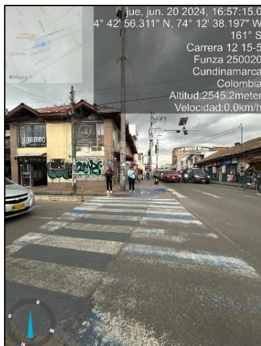
Ilustración 2. Evidencias recorrido